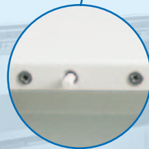
Protezione antisabotaggio: tamper antiapertura del contenitore