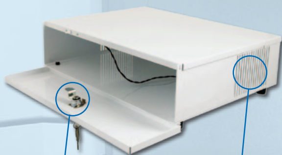
Il frontalino apribile