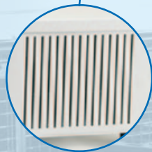
Foro di ventilazione