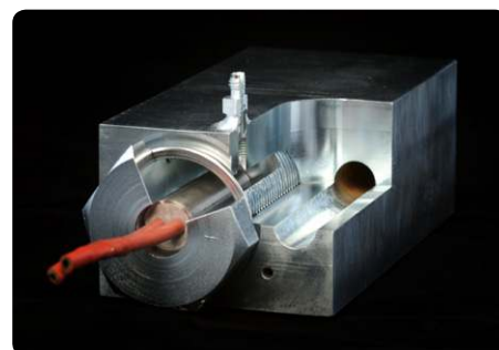
Particolare del blocco riscaldatore in acciaio lavorato.

Tutti i componenti sono prodotti a tolleranza esatta, fino ai canali che percorre il flusso della nebbia. Le nostre industrie sono leader mondiali anche nella produzione di sistemi di addestramento antincendio per compagnie come l'Autorità per l'Energia Atomica, l'Aviazione degli Stati Uniti e una moltitudine di gruppi di Vigili del Fuoco e centri di addestramento.